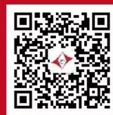
普华科技微信公众号